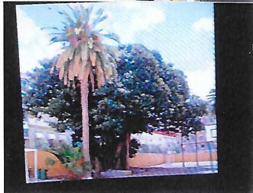
Foto de la consecución y salvamento del FICUS, así como la Construcción Del Centro de Salud. Inaugurado el lunes 3 de Abril a las 10,30 horas y que fuera. Solicitado a ALPERI. EN 2003 ¡!!A QUIEN NO PUDIMOS SALVAR FUE A LA PALMERA Que estaba como verán junto al mismo, ficus y era muy linda Si le hubieran cortado los jueves. O cataplines

Foto del tranvía por debajo de la Serra Grosa. Sin acabar. Pero que nos cuesta Protección y vigilancia, permanente