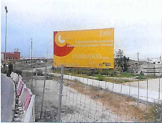
Foto entrada O SALIDA a San Gabriel desde Rotonda o glorieta Lorenzo Carbonell tan necesaria. Anunciada a bombo y platillo. Sin Acabar. presupuesto 21.000.000 de Euros. Ahí dejó el PP el muerto.