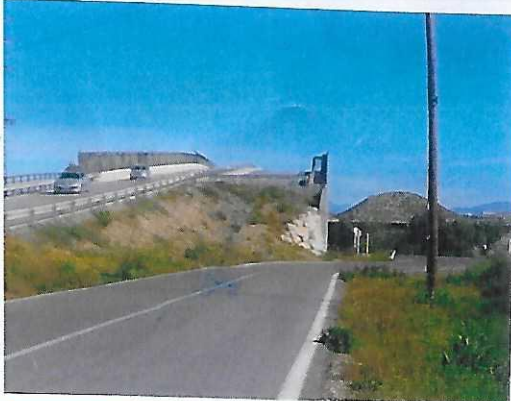
Foto superior de la doble calzada (Sin terminar) para unir LA VIA PARQUE Y EL PAU 1 con carretera de Ocaña y dar salida QUE EVITARIA ATASCOS desde Los Angeles. Al Rico Pérez ¡¡Solo construyeron, un carril en ambas direcciones . Del puente ¡¡Es muy necesaria para atajar sin pasar por SAN BLAS. Paralizada SINE DIE.- A falta de unos 400 metros.

Foto entrada O SALIDA a San Gabriel desde Rotonda o glorieta Lorenzo Carbonell tan necesaria. Anunciada a bombo y platillo. Sin Acabar. presupuesto 21.000.000 de Euros. Ahí dejó el PP el muerto.